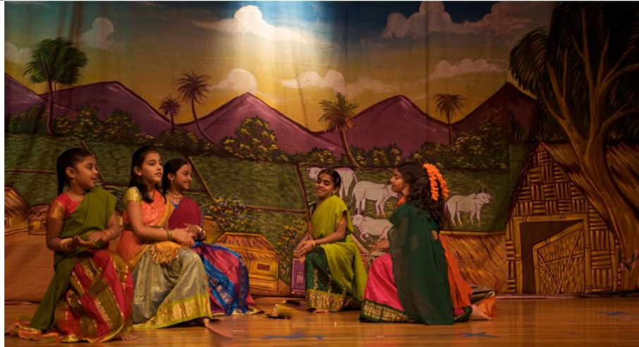
TASA Children presenting a Gobbillu dance during Sankranti Celebrations